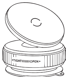
スマホホルダー本体